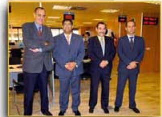
Presentación de las nuevas instalaciones de la Agencia Tributaria en Santa Cruz de Tenerife.