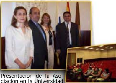
Presentación de la Asociación en la Universidad a alumnos en cursos de Asesoría Fiscal para Licenciados en Derecho