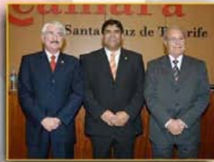
La Asociación asiste como invitada a la presentación de la base de datos Lexternet por las Cámaras de Comercio de Las Palmas y S/C de Tenerife