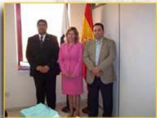
La Asociación recibida en el Juzgado de lo Mercantil de Santa Cruz de Tenerife