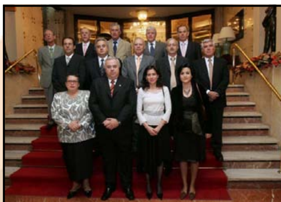
El Presidente de los Agentes Comerciales con los premiados

Estos actos culminaron con un animado baile que se celebró en los salones del propio hotel.