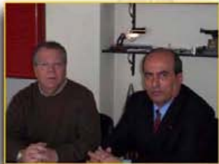
Reunión Tejido Empresarial: Seguridad Integral Canaria, S.A.