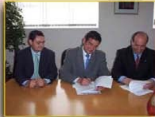
Firma convenio ULPGC y FULP para desarrollo programa de prácticas de alumnos universitarios