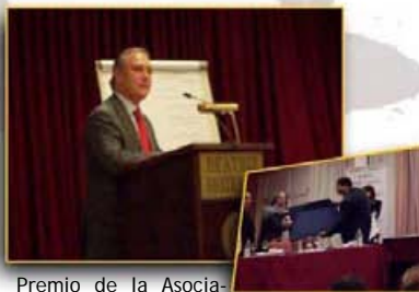
Premio de la Asociación a la Banca March por su colaboración en el año 2005