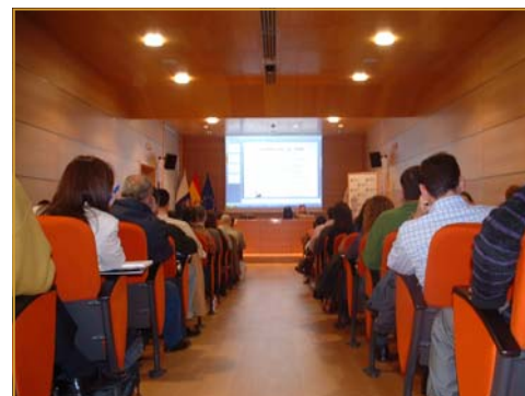
Salón de Actos de la Cámara de Comercio de Las Palmas.

E economistas Colegio de Santa Cruz de Tenerife