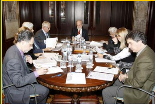
Miembros del Jurado de la XIX Edición de los premios Hacienda Canaria

que se derivan de la deducción por inversiones medioambientales del Impuesto sobre Sociedades y de la Reserva para Inversiones en Canarias resulta de gran interés